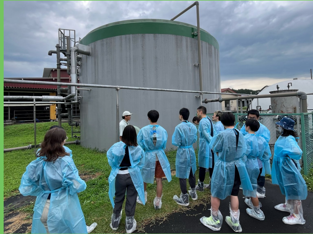
バイオガスプラント視察の様子 Biogas Plant visit