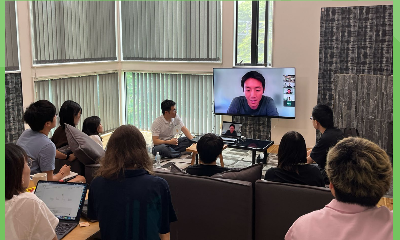
「先輩に聞く」の様子 Alumni talk