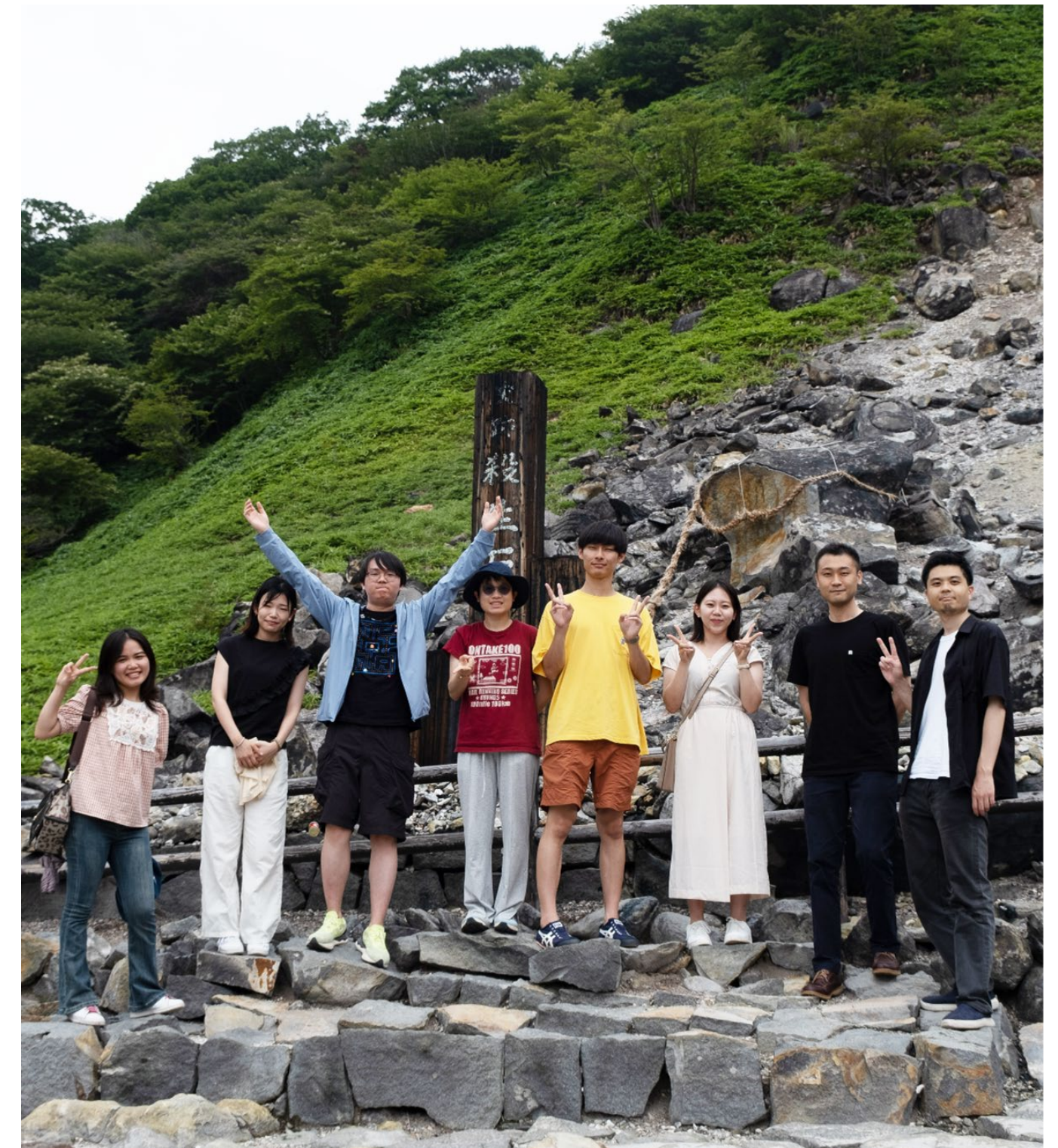
The list matches the order from left to right in the photo.