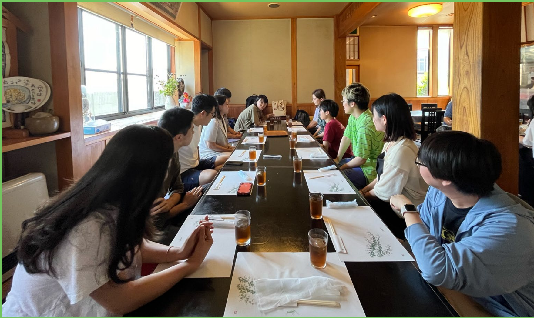
自己紹介の様子 Self introduction